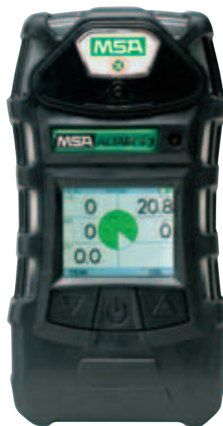
ALTAIR 5 z kolorowym wyświetlaczem