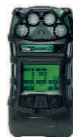
ALTAIR 5 z wyświetlaczem monochromowym